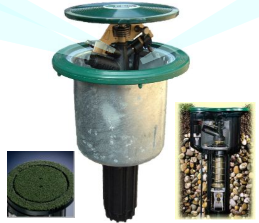
※人工芝装着タイプあり。