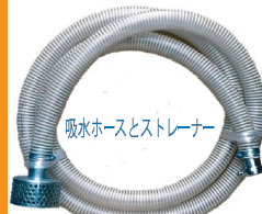
吸水ホースとストレーナー

ポンプに水を引き込む際に必要なホースです。ポンプ使用時に連結します。異物を吸い込まないようにストレーナーもご用意しております。