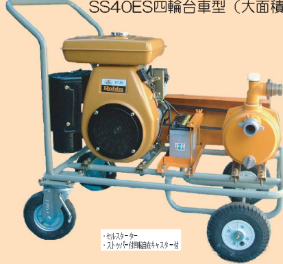
スーパーポンプエンジンセット SS40ES四輪台車型 (大面積用)