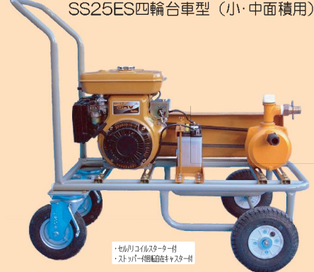
スーパーポンプエンジンセット SS25ES四輪台車型 (小・中面積用)