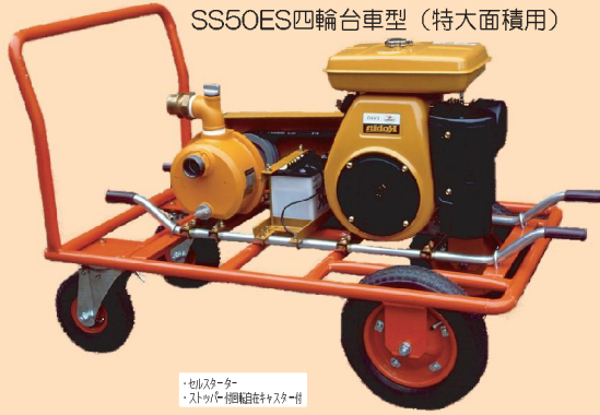
スーパーポンプエンジンセット SS50ES四輪台車型 (特大面積用)